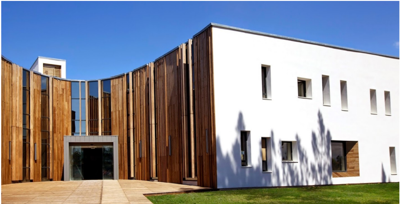
Centre Olatu Leku, au cœur de Baia Park à Anglet